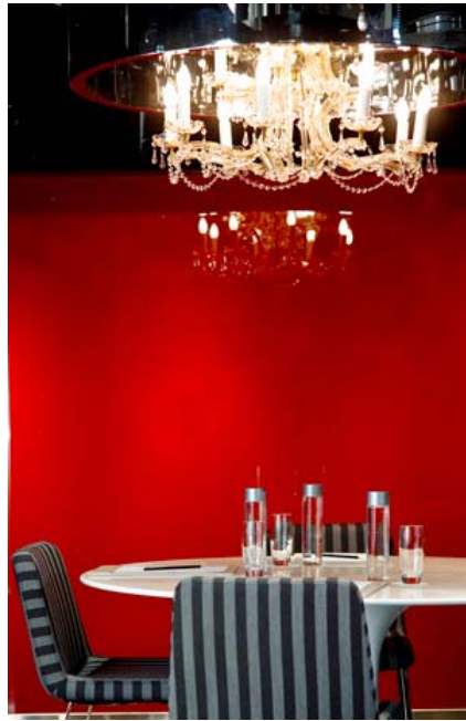
The Mira Club 行政樓層